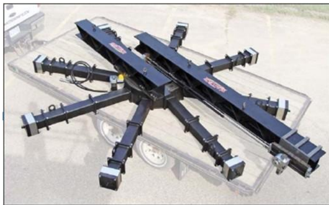
Máquina de refrentado de grandes diámetros DFM500

La máquina de refrentar Mactech LDFM 5000 se ha diseñado con capacidades para rectificado in situ de precisión, un solo punto, biselado y rectificado rotatorio en bridas de gran diámetro. Patas de montaje ajustables aseguran la máquina al diámetro interior de la pieza de trabajo. Entre sus características figuran avance mecánico desde varias rampas y velocidad variable en planos radiales y axiales. Opcionalmente, hay disponibles portaherramientas, cabezales de fresado y motores.