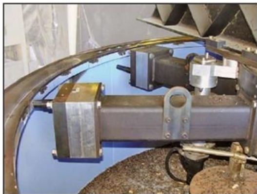
Patas de montaje ajustables

Refrentado y rectificado in situ de grandes diámetros